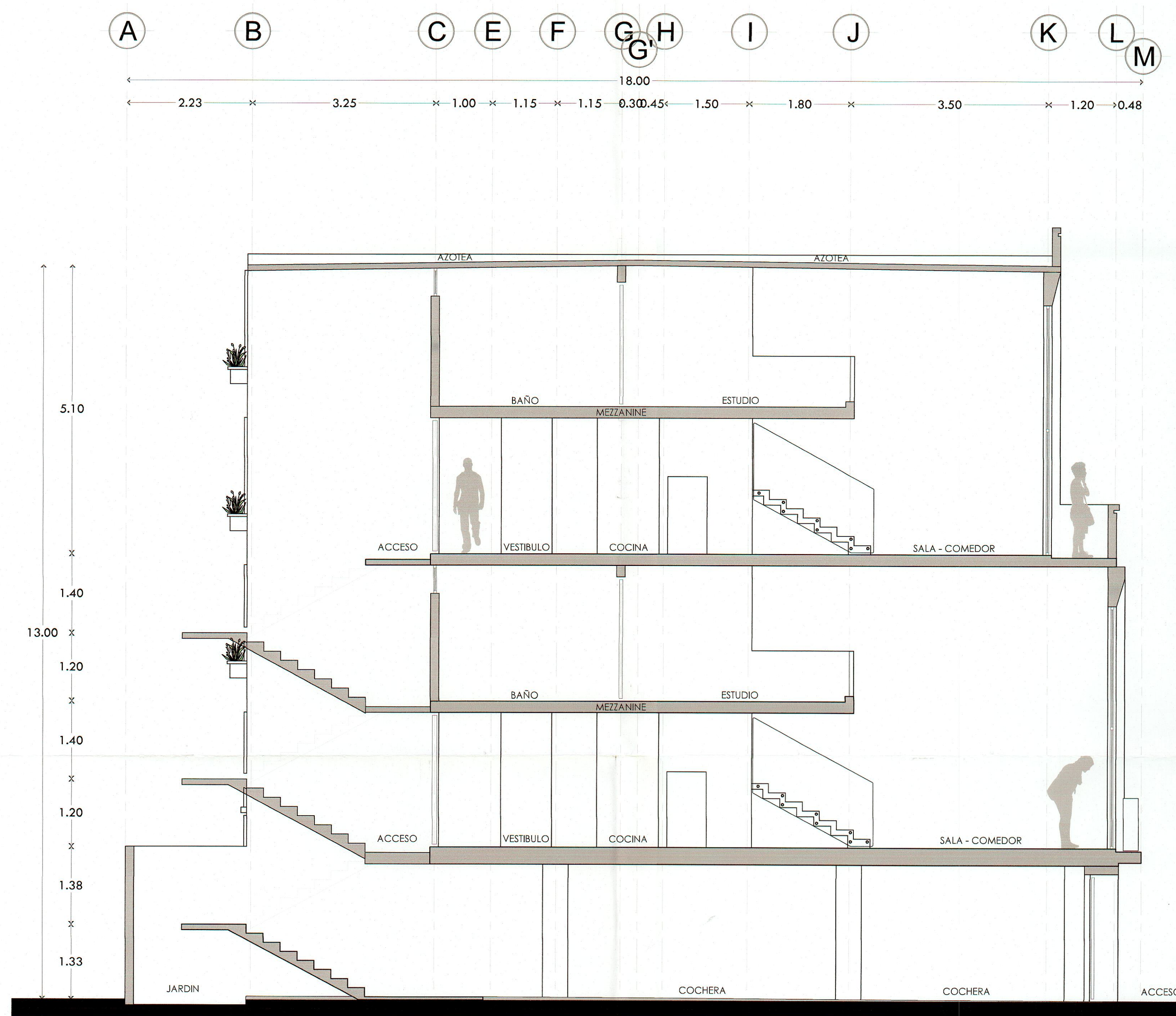
Corte A - A' Arquitectónico